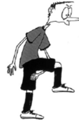
905 Klubba, fot eller ben mellan motståndares ben (handflatan snett uppåt)