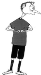
909 Hårt spel (handryggarna uppåt)