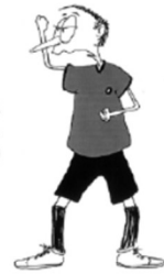
904 Hög klubba (markerar hållande av klubba)